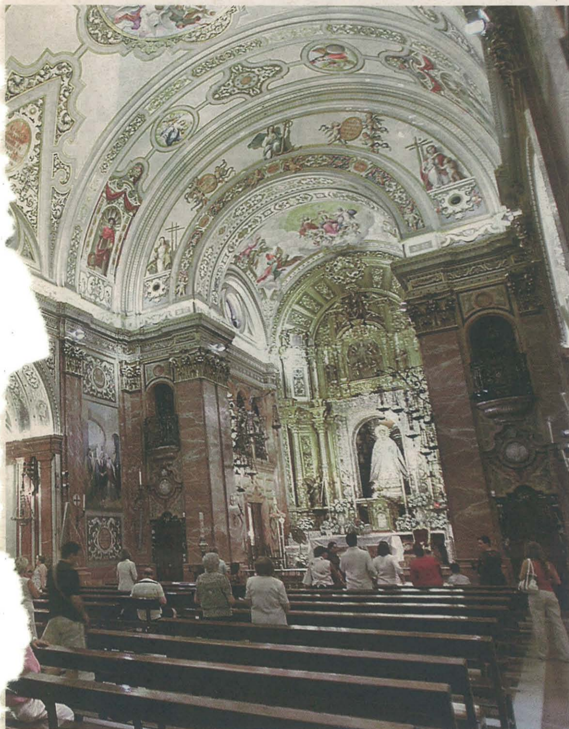
parte de sus instalaciones, como la casa hermandad