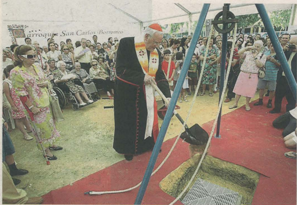
El cardenal deposita arena sobre la primera piedra ante la multitud